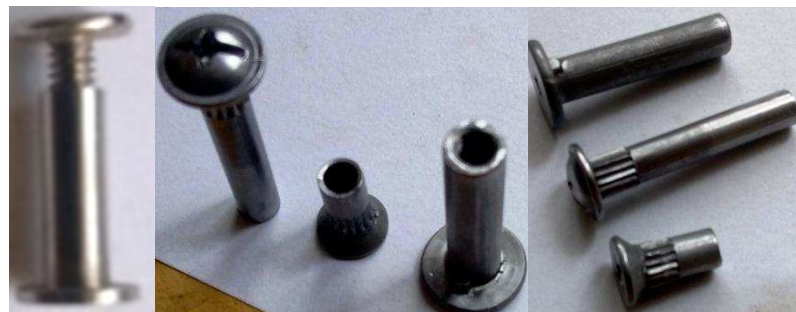
Linha moveleira de rebites com rosca interna