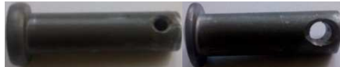
Furação em rebites, pinos, parafusos, etc. à partir de 1,5 mm