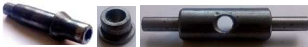
Peças usinadas sob medida, desenho ou amostra.