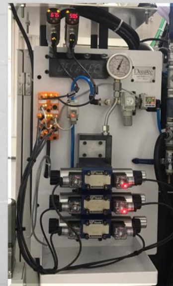
Integrações eletro-hidráulicas para controle da fixação via cnc do equipamento